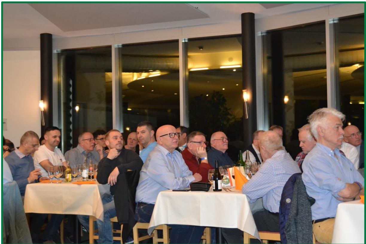
Abbildung 4: Schnapsschuss während der 100. DV 2023 in Maienfeld.